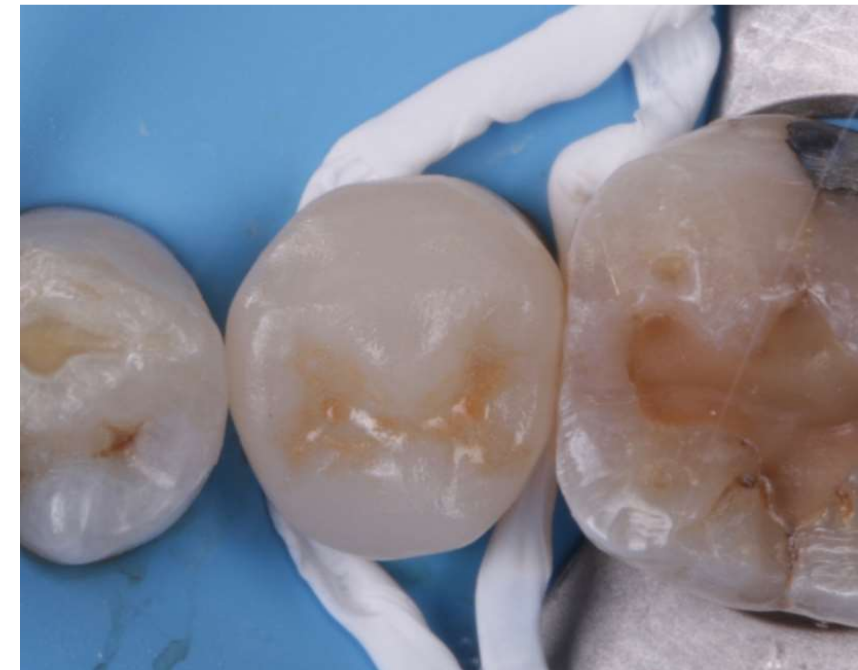
Prova de onlay cerâmico confeccionado no próprio dia