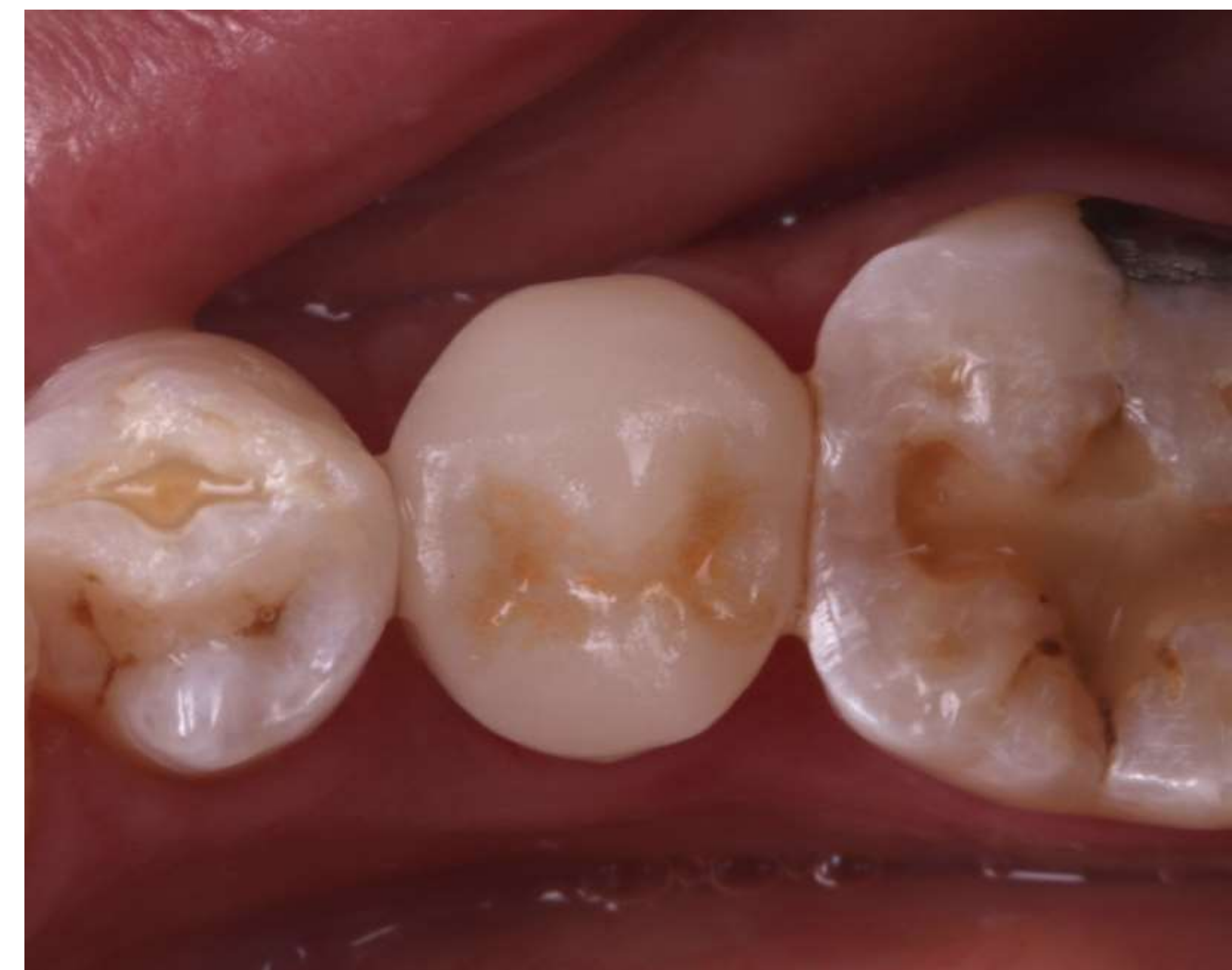
Cimentação e resultado final