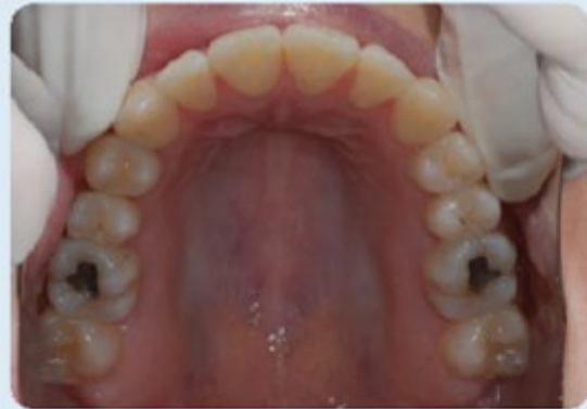
Mordida aberta anterior esquelética caso ortodôntico-cirúrgico-ortognático