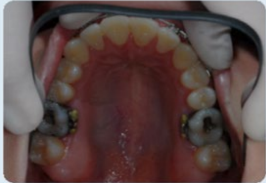
Mordida aberta anterior esquelética caso ortodôntico-cirúrgico-ortognático pré-cirúrgico