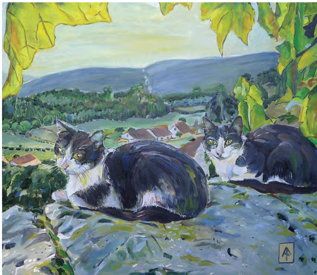
Retrato do Afonso e do Amendoim 70x60 - óleo sobre tela (2012)