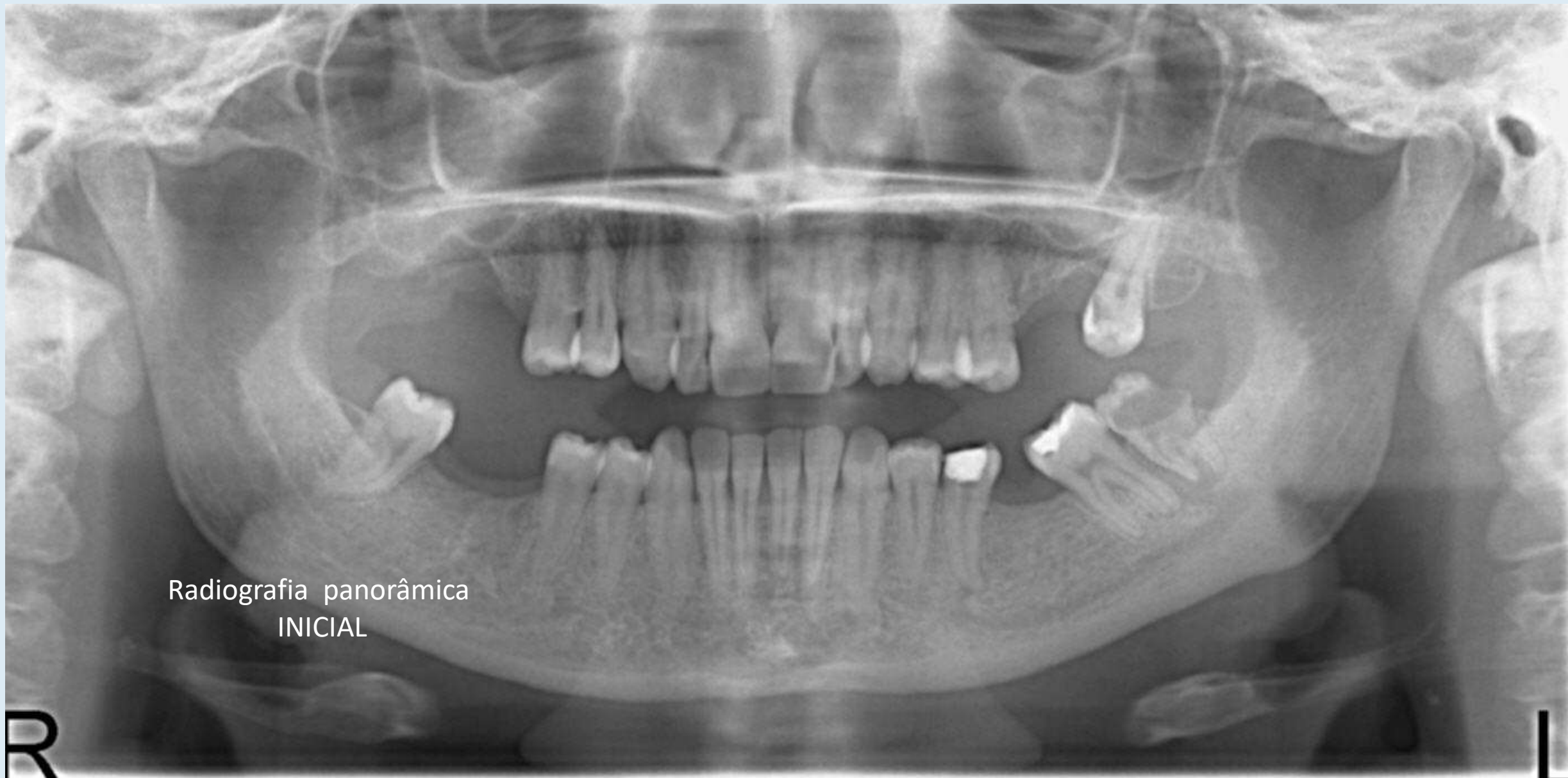
Radiografia panorâmica INICIAL