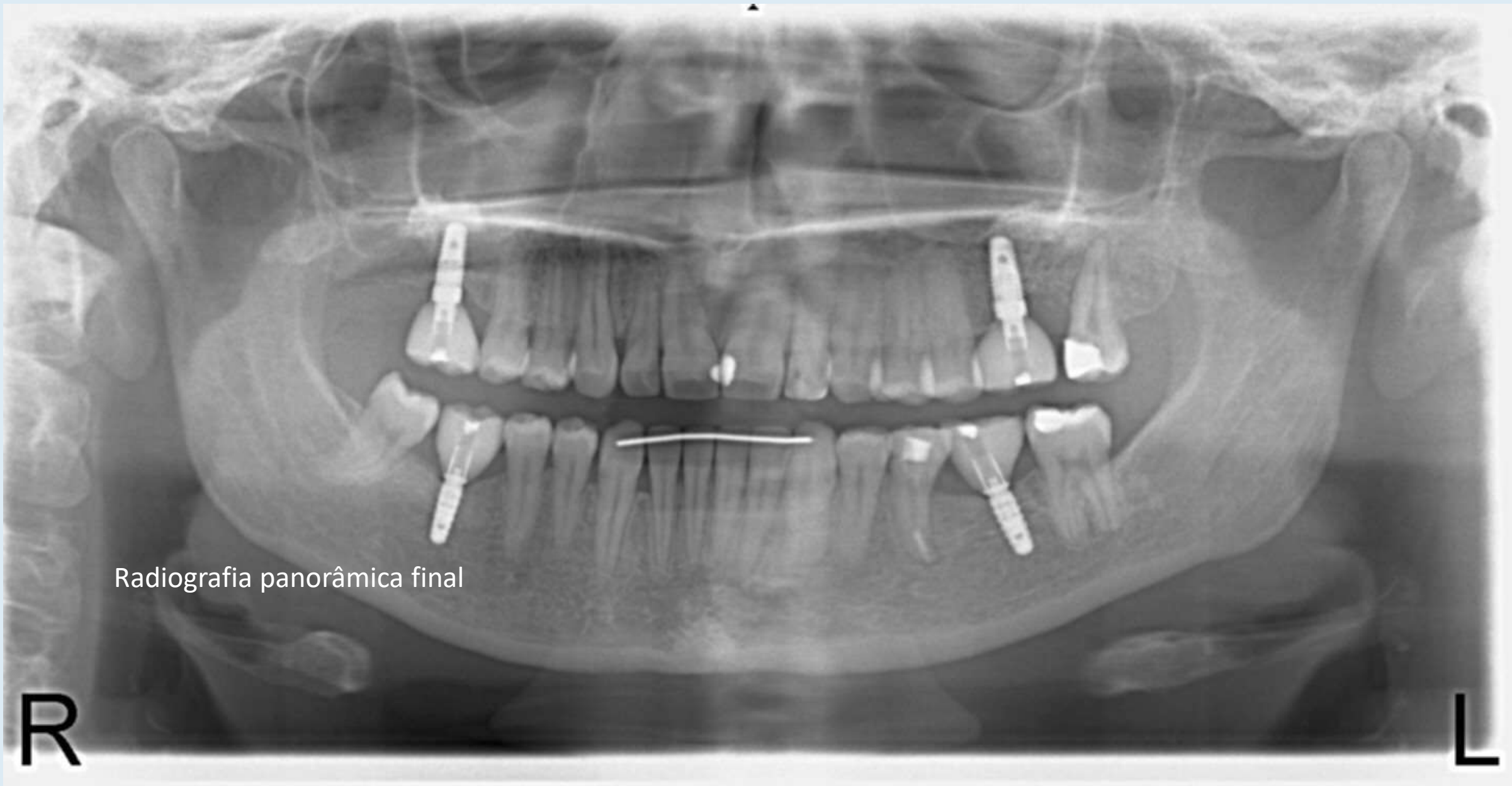
Radiografia panorâmica final