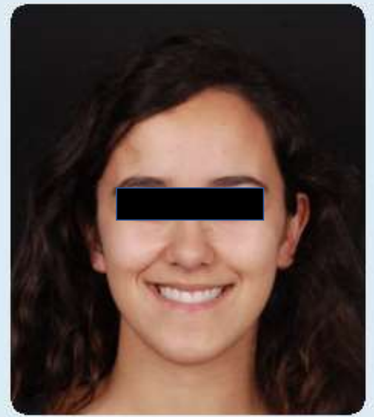
Caso interdisciplinar complexo INICIAL